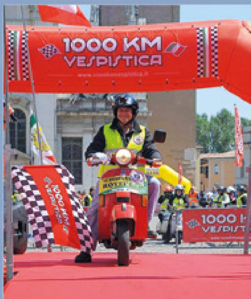
LA 1000 KM VESPISTICA 2015