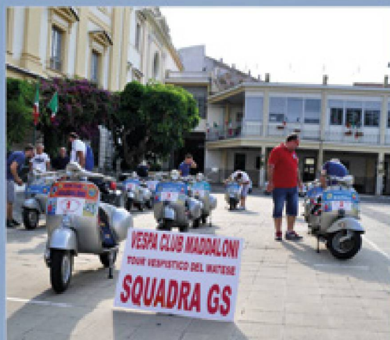
60 ANNI DI VESPA GS NEL MATESE